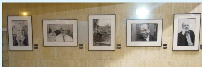
写真4 ノーベル化学賞受賞者写真展

世界各国から、科学者、学会代表、企業トップ、政府関係者らが1,000名以上出席し、世界化学年を祝い、盛り上げていくことを誓い合った。このセレモニーはユネスコとIUPACの主催で行われ、初日は、イリナ・ボコワ ユネスコ事務総長、ニコル・モロー IUPAC会長の開会宣言に続き、フランスのパレリ・ペクレス高等教育・研究大臣、テショミ・ト