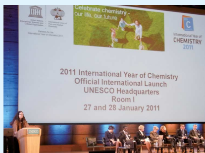
写真1 開会宣言と祝辞

本年は世界化学年 (International Year of Chemistry 2011) である。開幕を宣言する International Year of Chemistry 2011 Launch Ceremony が、1月27日と28日の両日、パリのユネスコ本部大会議室で開催された。